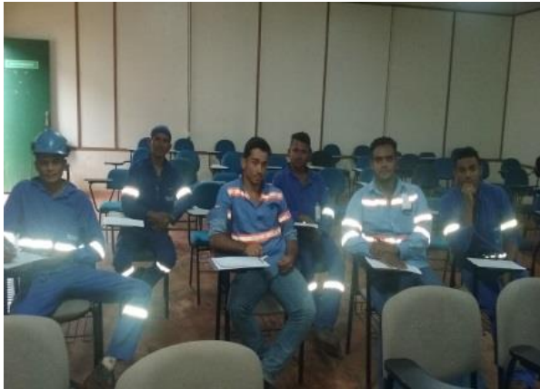
Treinamento dos monitores e motoristas.